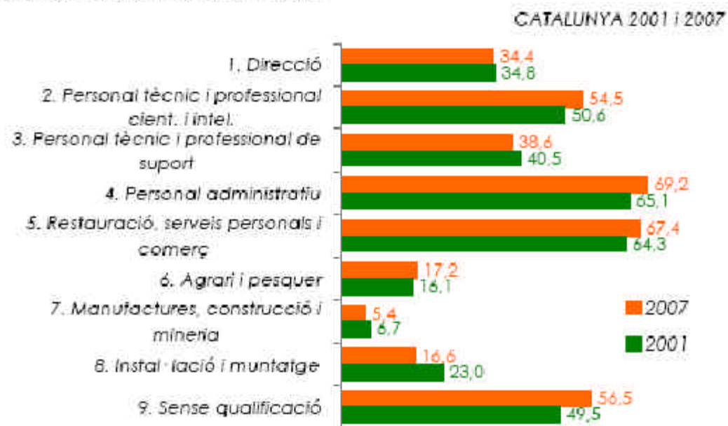
PERCENTATGE DE DONES SOBRE EL TOTAL DE PERSONES OCUPADES EN CADA GRUP D'OCUPACIÓ

En les ocupacions dels grups 4, 5, 9 i 2, l'any 2007, la proporció de dones ocupades supera la d'homes. Destaca l'increment, respecte l'any 2001, de la presència femenina en les ocupacions sense qualificació.